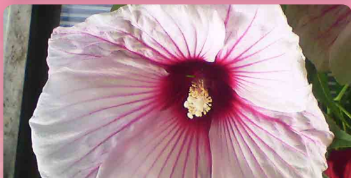
Ibišek americký Kooper King®