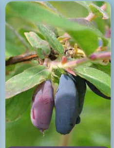
Zimolez kamčatský Vostorg