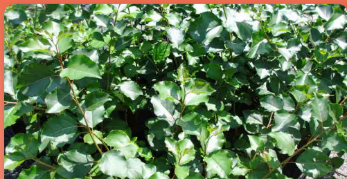
Japonský topol klon J-105