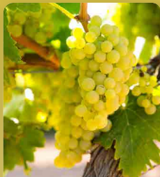
Réva Arkádia (Nasta)