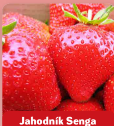
Jahodník Senga Sengana