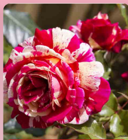
Růže velkokvětá Papageno