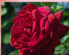
Růže velkokvětá Burgund