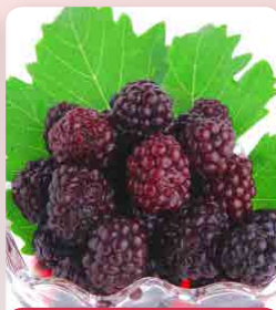
Maliník Glen Coe

Maliník Glen Coe – beztrnný, stálezplodící 89,- Plody jsou fialové barvy a mají výbornou, sladkou chuť. Zrají od poloviny června. Dobře odolný chorobám.