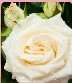
Růže velkokvětá Chopin