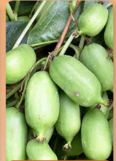
Kiwi Arguta Issai