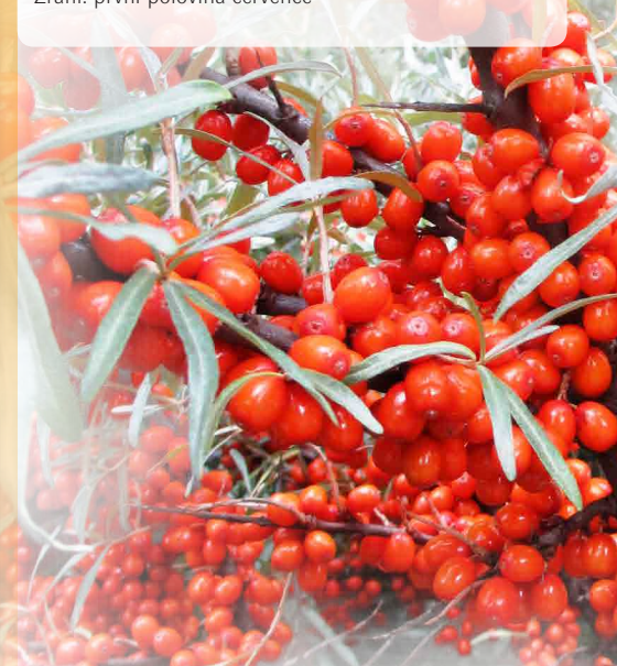
Rakytník řešetlákový Sibiřský ruměnc