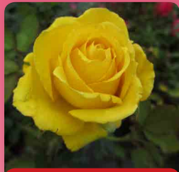
Růže polyantka Arthur Bell