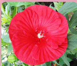
Ibišek americký Cranberry Crush®