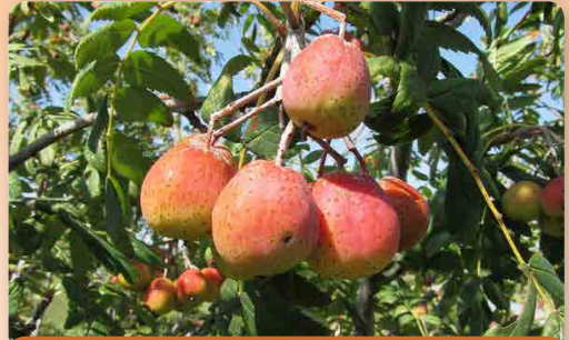
Jeřáb Oskeřuše Sossenheimer Riesen