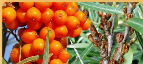
Rakytník řešetlákový DUO