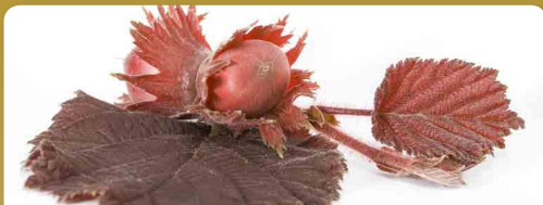
Líska červená Purpurea