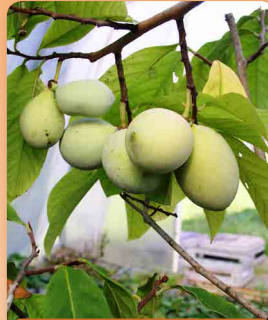
Asimina triloba Prima