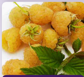
Maliník žlutý Golden Everest