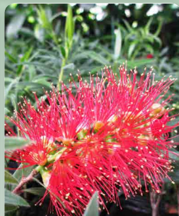
Štětkovec Mini red