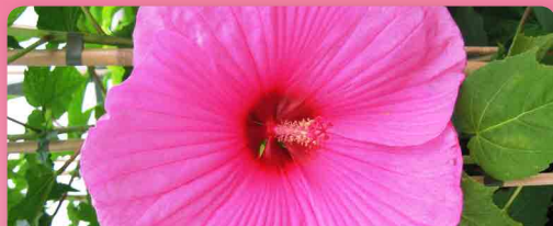
Ibišek americký Royal Gem®

Extrémně velké, sytě rudé květy nakvétají na tomto ibišku celé léto. Má nižší vzrůst, do 1m a je díky tomu vhodný i pro pěstování v nádobách.