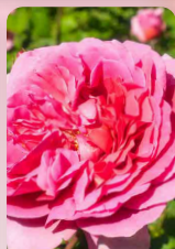
Růže polyantka Leonardo Pink