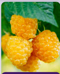
Maliník oranžový Valentina