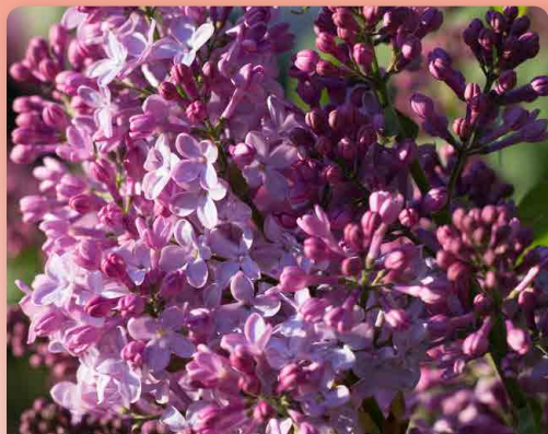
Šeřík keřový „Josée“