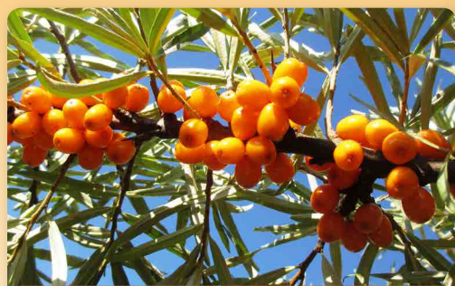
Rakytník řešetlákový Sluníčko