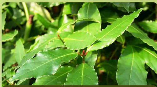
Vavřín – bobkový list