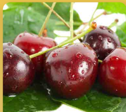
Třešně a višně