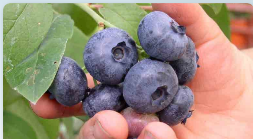
Obří kanadská borůvka

Obří kanadská borůvka 89,- Úrodná, nenáročná a chuťově vynikající. Tento keř zvládne pěstovat každý. Většina odrůd je částečně samo-sprašných, pro dosažení vysokých výnosů doporučujeme vysadit 2 různé odrůdy.