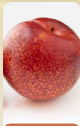
Ostatní ovocné stromky