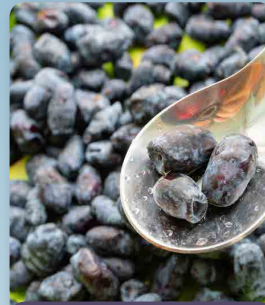
Zimolez kamčatský Boreal Beauty