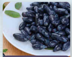
Zimolez kamčatský Jugana