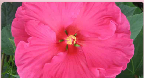
Ibišek americký Jazberry Jam®