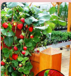
Superpřevíslý jahodník Maranell®