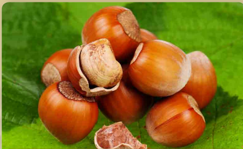
Líska Halská obrovská