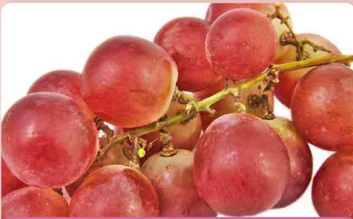
Réva Red Globe