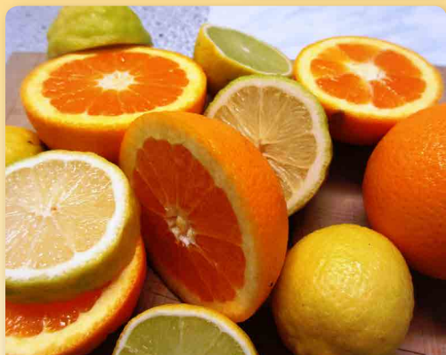
Citrusy různé druhy