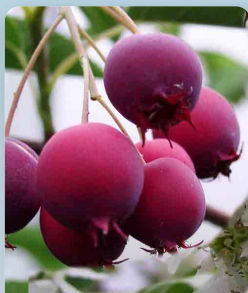
Indiánská borůvka Vicky