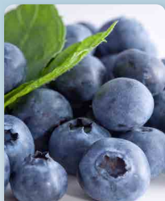
Obří kanadská borůvka Big – Chandler