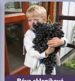
Réva skleníková Kardinál