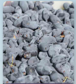
Zimolez kamčatský Aurora