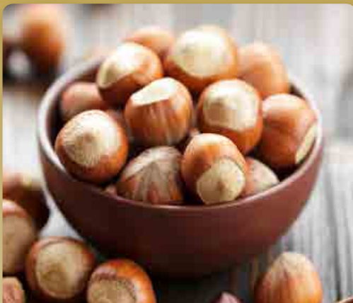
Líska Red Zeller