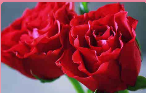
Růže polyantka Hommage a Barbara