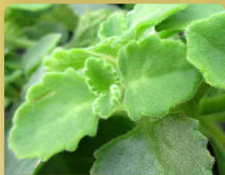
Rýmovník mexický/ eukalyptový