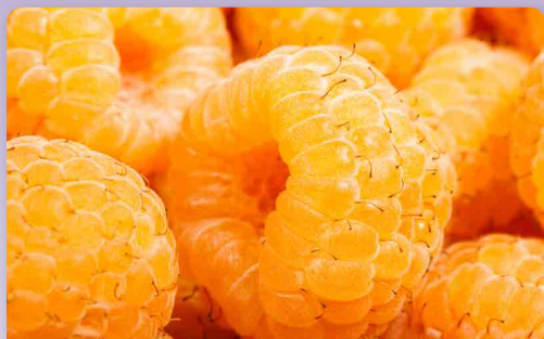
Maliník žlutý Sugana Gelb