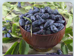
Zimolez kamčatský Sinij Utes