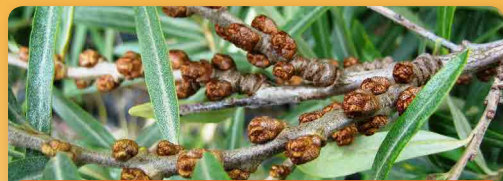
Rakytník řešetlákový samec

Rakytníky jsou keře s plody plnými vitamínů. Je nutné vždy vysazovat samčí a samičí rostlinu. K jedné samčí rostlině může být až 7 samic.