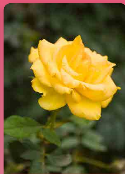
Růže polyantka Fresia