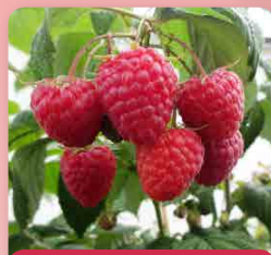
Maliník Autumn Bliss