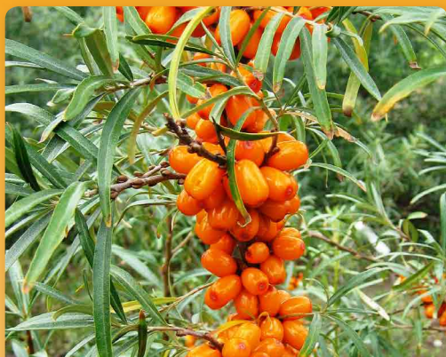
Rakytník řešetlákový Rosinka