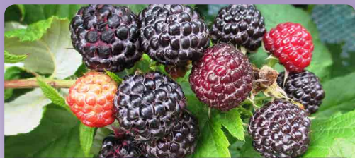
Maliník černý Black Jewel