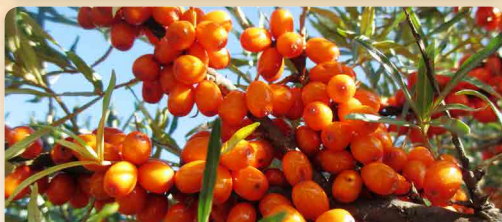
Rakytník řešetlákový Krasavice