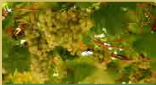
Réva Čabaňská Perla