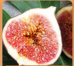
Fíkovník Brown Turkey