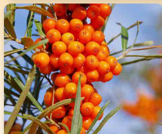
Rakytník řešetlákový Nela