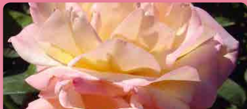
Růže velkokvětá Gloria Dei