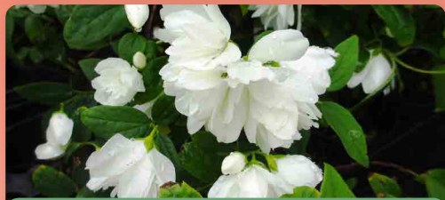
Jasmín pustoryl „Snowbelle“