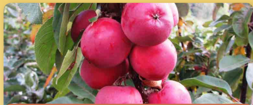
Ovocné stromky pro sloupovité pěstování