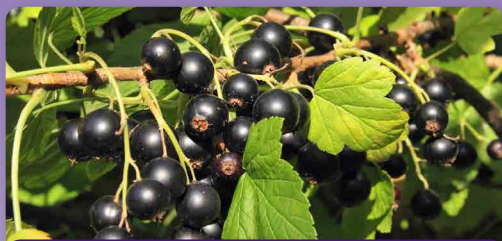
Rybíz černý Titania

Beztrnný kříženec angreštu a černého rybízu. Plody jsou větší bobule s výbornou, sladkou chutí a vysokým obsahem vitamínu C. Jsou vhodné k přímému konzumu nebo na další zpracování.