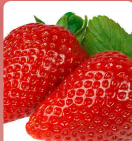
Jahodník San Andreas