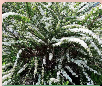
Tavolník bílý „Snowmound“