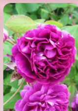
Růže pnoucí Violette Per- fume