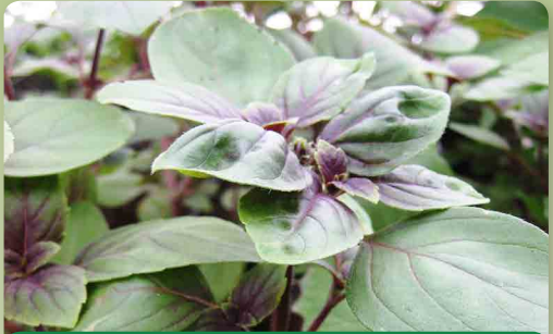
Bazalka vytrvalá „Africanblue“