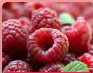
Maliník Glen Ample