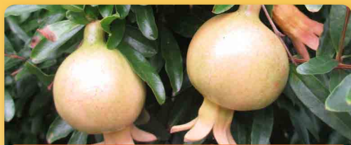
Granátové jablko Nana Gracilissima