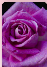
Růže velkokvětá Vio- lette Perfume