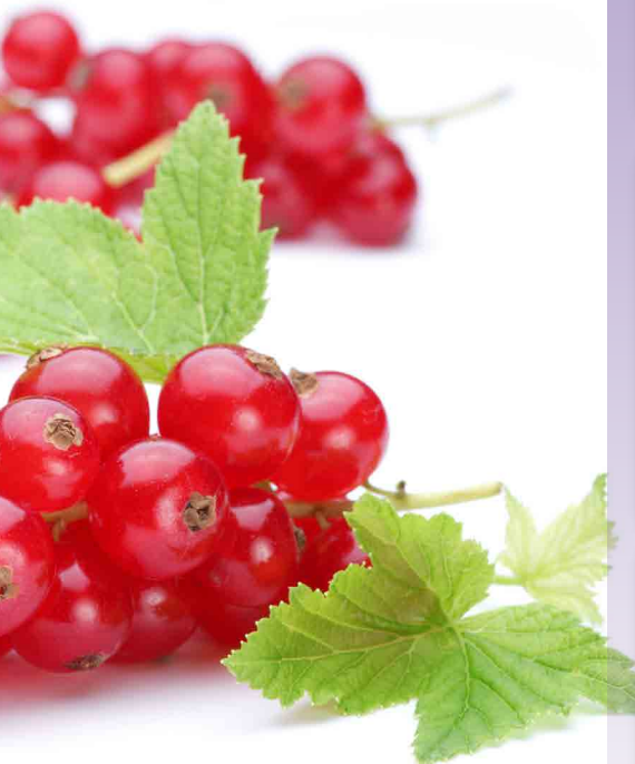
Rybíz červený Jonkheer