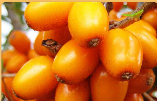
Rakytník řešetlákový Botanika