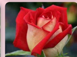
Růže velkokvětá Kronenbourg