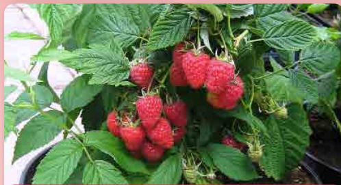
Maliník BonBonBerry Yummy