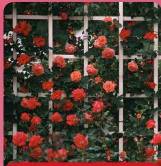
Růže pnoucí Cap Horn