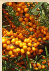
Rakytník řešetlákový Žemčuzina