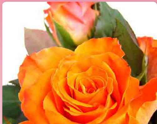
Růže polyantka Orange Sensation