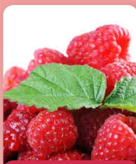
Maliník Zewa III

Výborné plody s typicky malinovou, skvělou a intenzivní chutí. Pochutnáte si na nich od července. Nenáročná a odolná odrůda.