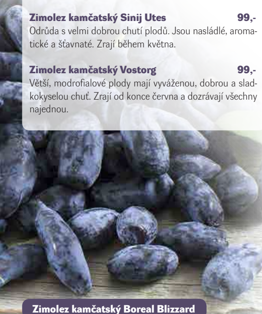
Zimolez kamčatský Boreal Blizzard