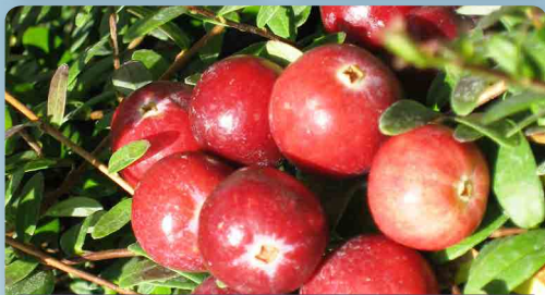
Maxibrusinka Cranberry Red