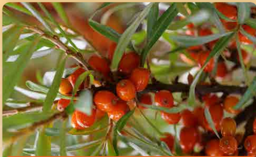
Rakytník řešetlákový Voroběvská