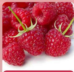
Maliník Himbo Top