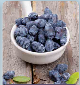
Zimolez kamčatský Honeybee