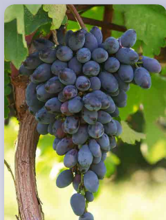
Réva Black Magic