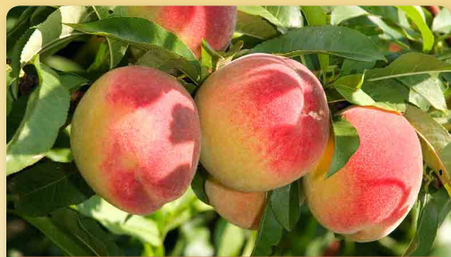
Broskvně a nektarinky