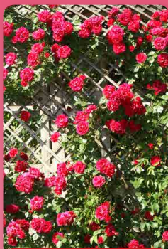
Růže pnoucí Paul Scarlet

Výrazně zbarvenými, sytě oranžovými květy zaujme tato odrůda. Je velmi vhodná k řezu.