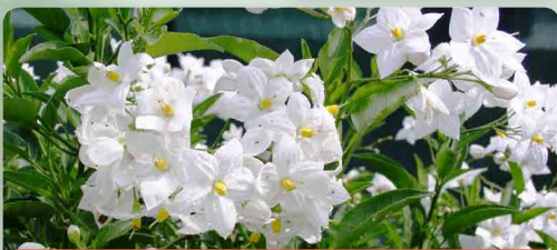
Lilek jasmínokvětý bílý/fialový