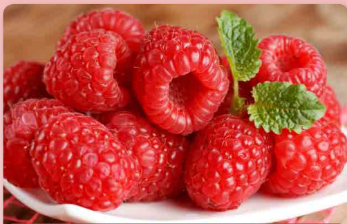
Maliník Aroma Queen