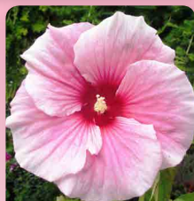
Ibišek americký Summer Storm®